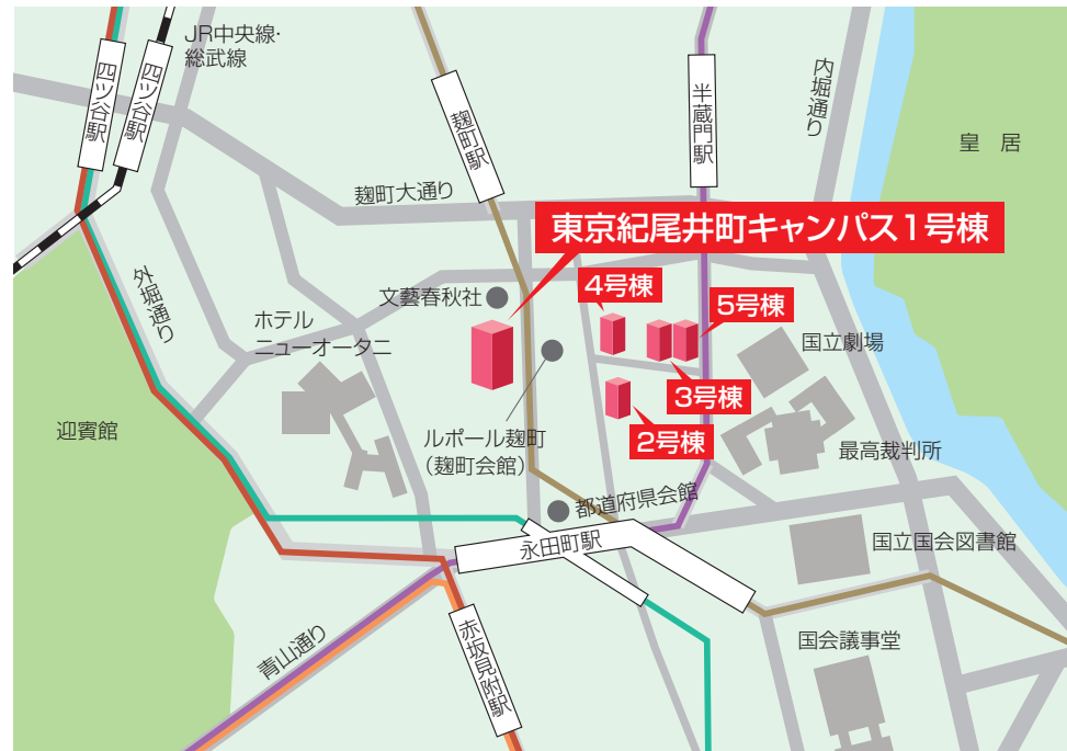
城西国際大学 東京紀尾井町キャンパス 案内図

— 東京メトロ有楽町線 — 東京メトロ銀座線 — 東京メトロ南北線 — 東京メトロ半蔵門線 — 東京メトロ丸ノ内線 — JR線