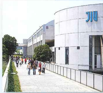
千叶东金校区 〒283-8555 千葉県東金市求名 1 TEL.0475-55-8855