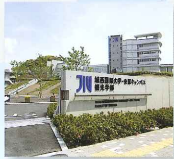
安房校区 〒299-2862 千葉県鴨川市太海 1717 TEL.04-7098-2800