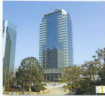
幕张校区 〒261-0023 千葉県千葉市美浜区中瀬 1-7-1 住友ケミカルエンジニアリングセンタービル 22F TEL.043-297-2521