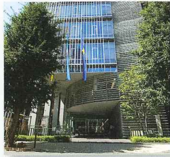
东京纪尾井町校区 〒102-0094 東京都千代田区紀尾井町 3-26 TEL.03-6238-1111