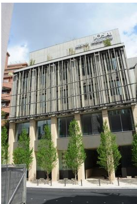
3号馆（教室、国际会议厅、博物馆）