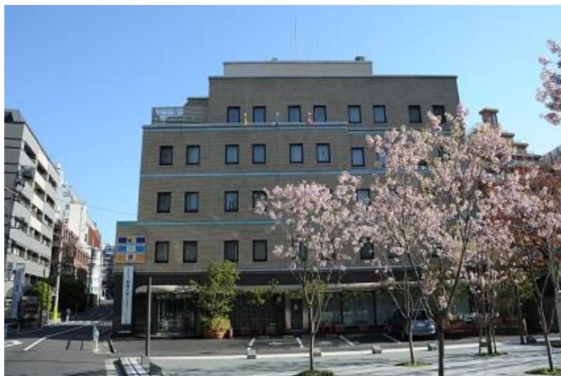
2号馆（同窗会、住宿设施）