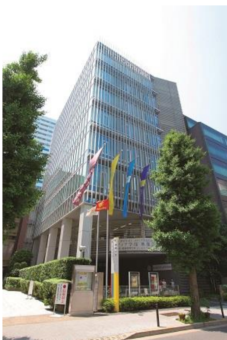
1号馆（法人本部、教室、大会堂）