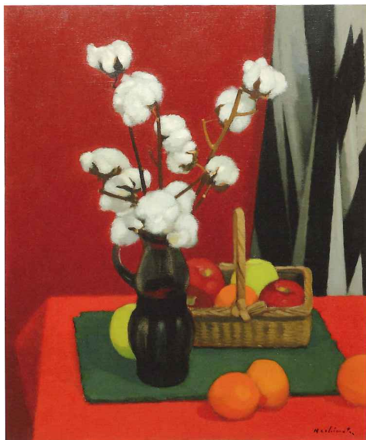
左上より 《赤い燈台》Red Lighthouse, 1975年、72.7×60.6 cm、学校法人城西大学寄託 《綿花と果物》Still Life with Cotton and Fruit, 1982年、72.7×60.6 cm、学校法人城西大学蔵 《外房の浜》The Beach of Sotobō, 1981年、60.6×80.3 cm、学校法人城西大学寄託 《少女》Girl, 1970年、33.4×24.3 cm、個人蔵 《漁港にて》In the Fishing Port, 1981年、50.0×65.2 cm、学校法人城西大学寄託、以上、油彩、キャンバス