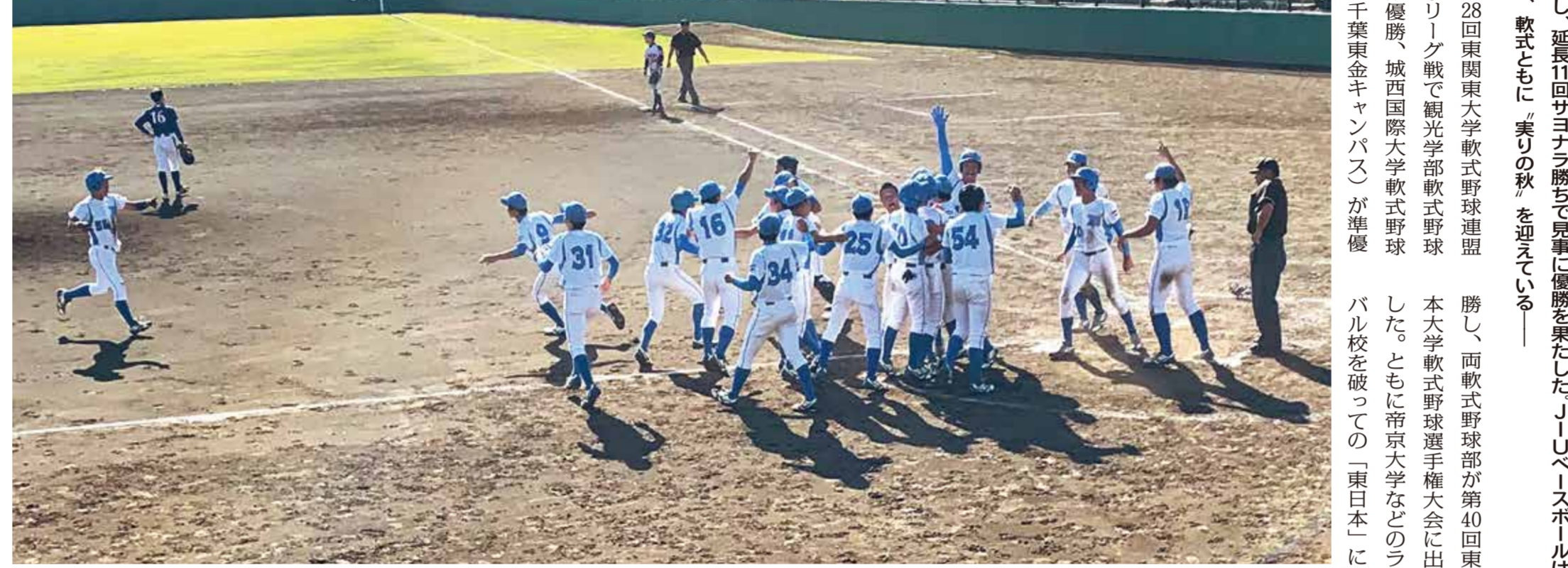
東日本大学軟式野球部の決勝戦、サヨナラのホームインで優勝決定の瞬間