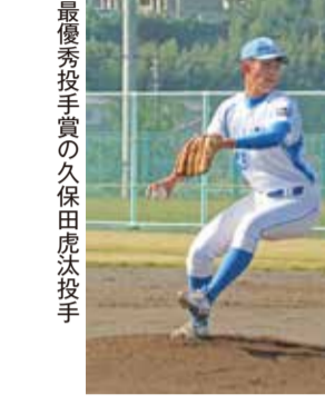
観光学部軟式野球部

東日本大学軟式野球選手権大会の戦績 第1回戦 5-2 駒澤大学 第2回戦 9-2 流通経済大学 (七回コールド) 第3回戦 5-2 作新学院大学 準決勝 4-3 日本体育大学 決勝 6-5 白岡大学 (全日本大学軟式野球連盟に規定より、夏に全国大会、秋に西日本大会・東日本大会の開催となっている)