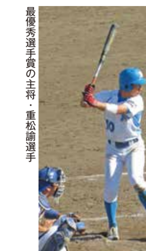
観光学部軟式野球部

合を計4失点に抑える力投ぶり。応援に駆けつけた観光学部協力会、観光学部軟式野球部後援会、鴨川市民、学生、教職員らは、惜しめない拍手を送った。