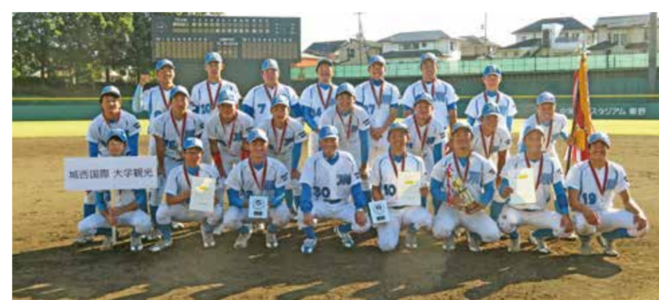
優勝旗とともに笑顔の選手たち 東日本大学軟式野球部