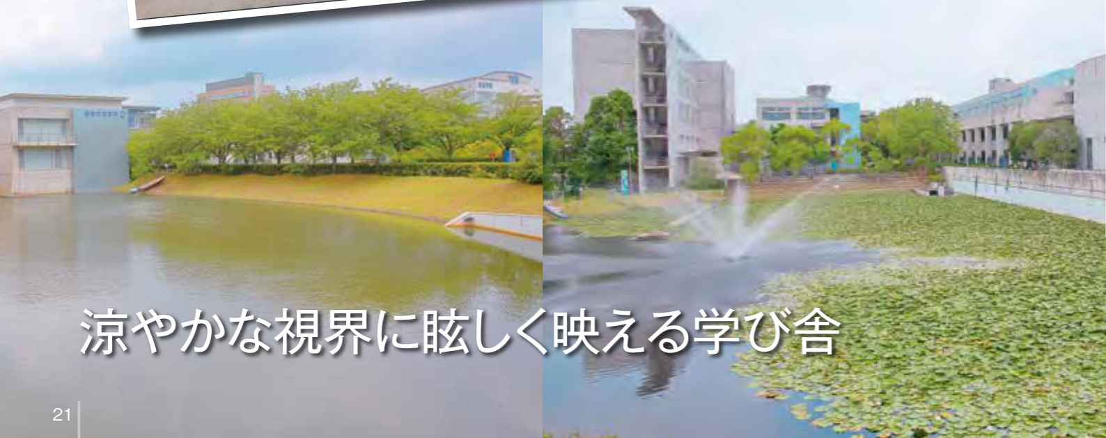
涼やかな視界に眩しく映える学び舎