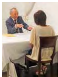
地区懇談会での面談の様子

また、父母後援会は大学祭にも参加しており、全国の11支部の方が地元の名産物などをたくさん持ち寄り販売する物産展を開催しています。地域の方々は毎年、この全国物産展を楽しんでいます。