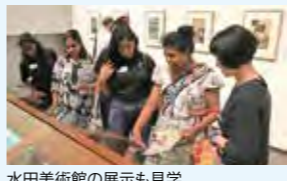
水田美術館の展示も見学

8月24日に東金キャンパスにおいて開催された。本セミナーには、本学学生の他、大学近隣の九十九里地域からも医療機関・福祉施設関係者が多く参加するなど、地域密着型の医療・福祉専門職を目指す若者たちの学びの場となっており、今年度は約60名が参加した。