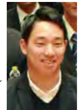
プロ野球選手 宇佐見真吾さん

6月28日に入団会見が行われ、背番号は「30」。会見後に行われた対福岡ソフトバンクホークス9回戦に途中出場を果たした。トレードから約1週間後となる7月2日の対埼玉西武ライオンズ戦ではプロ初の猛打賞を達成すると共に、移籍後初のタイムリーも放つなど大活躍だった。新天地での活躍が期待される。宇佐見選手にエールを――。