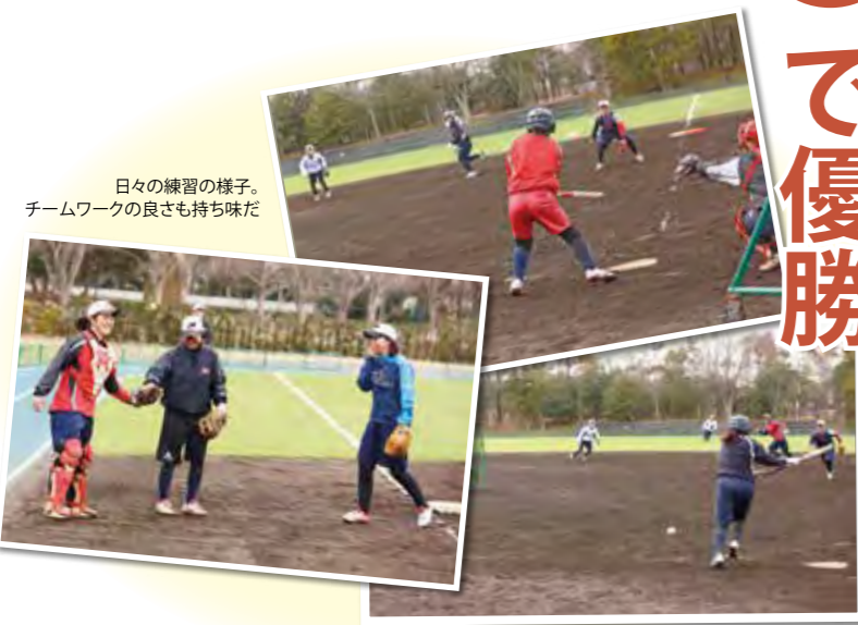
日々の練習の様子。チームワークの良さも持ち味だ