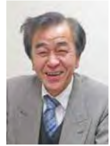
〔略歴〕1951年、東金市生まれ、68歳。1970年、千葉県立東金商業高校卒業。浅草・雷門の蕎麦店で修業後、蕎麦店「東京庵」を継ぐ。5代目。現在、「株式会社 東京庵」の代表取締役。