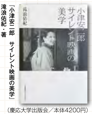
「小津安二郎 サイレント映画の美学」(慶応大学出版会/本体4200円)

品において、2012年には第1位になったほどだ。小津に関する評伝、研究、論文も、戦後作品を中心に取上げたものがほとんど。初期にサイレント映画の傑作を多数生みだしていることについての研究、論文などは限られていた。 滝浪先生は「小津は、若い時にハリウッド映画を何回も観て勉強し、それを応用しながら自分の映画スタイルを確立し、巨匠と言われるようになった。若い学生にも参考になると思う」と話す。