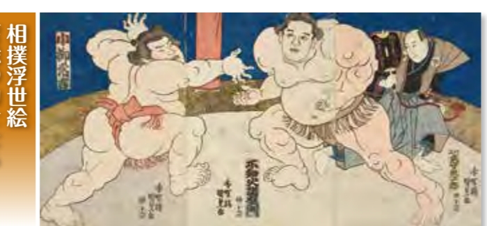
歌川国貞・示知火諾右門小柳常吉

サッカークラウンドは、選手らの健康管理に配慮し、夏場における表面温度上昇を抑えるような人工芝を施している。また、ナイター設備もあり、ピッチには観覧席を設けている。クラブハウスは、監督室やミーティングルーム、ロッカールームなどを設けるとともに、屋上に観覧席を配置している。スポーツパークは、サッカー部が利用するほか、青少年の育成など地域のスポーツ振興に生かしていくとともに、スポーツを通しての国際親善・交流活動の拠点としても活用している。