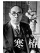
戦後の混乱期に経済復興と成長に精力を傾けた元大蔵大臣・水田三喜男の評伝『水田三喜男伝 寒椿（つげろ）』II 写真