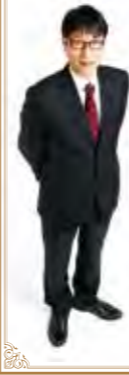
城西国際大学学長 杉林 堅次

城西国際大学では1992年開学当初からグローバル教育を推進し、世界の195の大学等と交流しています。充実した語学教育や留学制度などを通して、総合大学として多彩な学びを展開し、グローバル社会で活躍するための素養を身につけた人材を輩出しています。すなわち、SDGsのゴール4「すべての人に包摂的かつ公正な質の高い教育を確保し、生涯学習の機会を促進する」、ゴール17「持続可能な開発のための実施手段を強化し、グローバル・パートナーシップを活性化する」につながる活動として、SDGs達成に貢献しています。2015年に持続可能な開発目標(SDGs)が国連サミットで採択され「持続可能な開発のための2030アジェンダ」に明記されました。地球上の誰一人として取り残さないことを誓い、世界各国が2030年までに取り組むユニバーサルな目標です。世界各地から学生が集う「国際大学」は、広い視野と寛容な心を育める環境を実現し、それを維持・発展させなければなりません。この意識を「国際大学」として強く持ち、東京紀尾井町・千葉東金・安房の3キャンパスの学生を教職員中心にご父母や関連する皆様方とともに、様々な工夫と実践を続けていくことをここに宣言します。