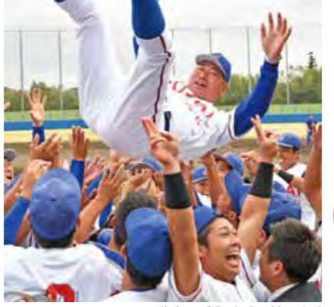
秋季リーグ戦で優勝し監督を上げ

千葉県リーグ戦 2季連続6度目優勝 初春秋連覇 関東地区大学野球選手権大会に先立つ千葉県大学野球秋季リーグ戦では、第4節まで全勝勝ち点4で、最終節を待たず秋季リーグ戦の優勝が決定し、初の春秋連覇を達成した。リーグ戦の優勝は通算6度目。最終的に10勝1敗勝ち点5で秋季リーグ戦を終了し、2季連続の優勝を果たした。秋季リーグ戦の個人成績が発表され、4名の選手が選出された。