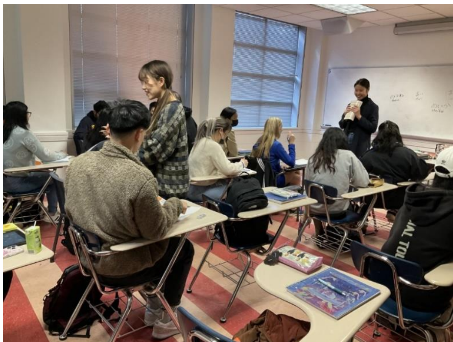
UCR で開講されている日本語授業を訪問しての交流

日本からの留学生が、できるだけ多くの現地の学生と交友関係を結べるように、UCR の教員や学生と連絡を取り合いさまざまな交流の場を持てるように調整しています。