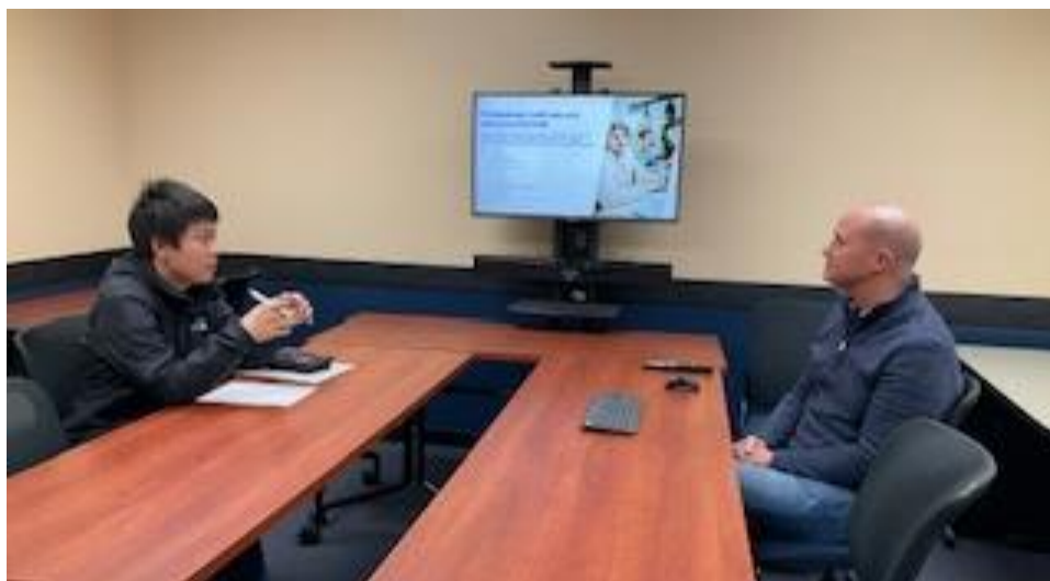
UCR スタッフからの個別プログラム説明会

https://extension.ucr.edu/internationaleducationprograms/programpages/postgraduatecertificateanddiplomaprograms