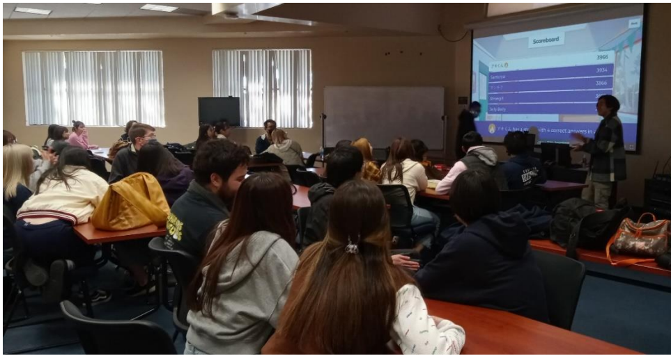
日本語サークル主催のイベント（日本のアニメについてのオンラインゲーム）