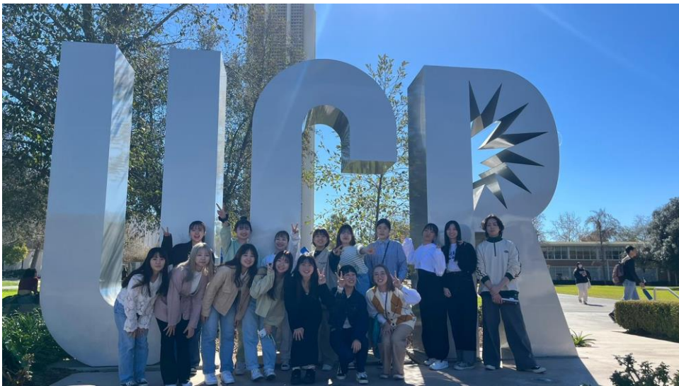
国際人文学部国際交流学科の国際交流研修