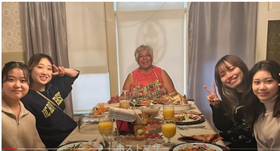
ホームステイの魅力を伝えるビデオ・プロジェクト成果物（国際交流学科 HP）

https://www.jiu.ac.jp/intl-exchange/news/detail/id=13034