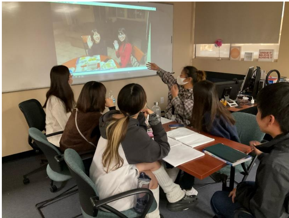
授業での話し合い