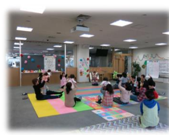
昨年度の活動の様子