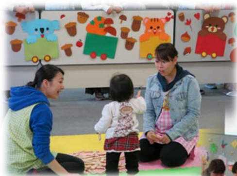
~これまでの活動の様子~