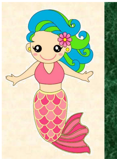
大網白里市のキャラクター『マリン』