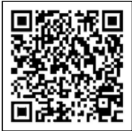
インターネット出願サイト QRコード