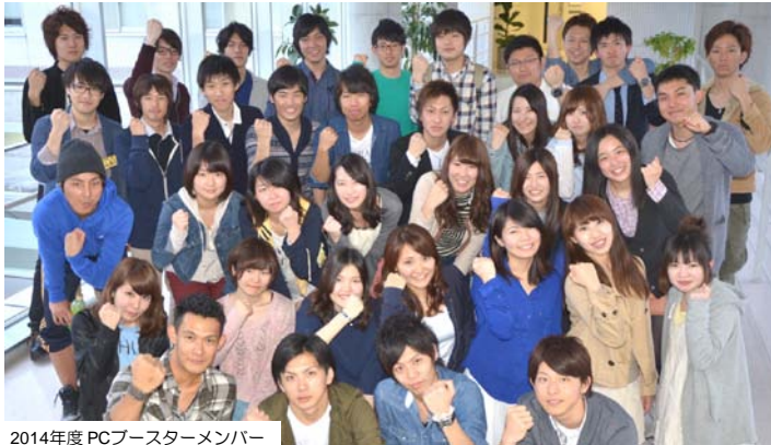
2014年度 PCブスターメンバー