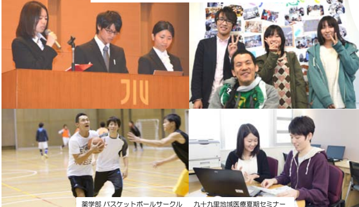
薬学部 バスケットボールサークル 九十九里地域医療夏期セミナー