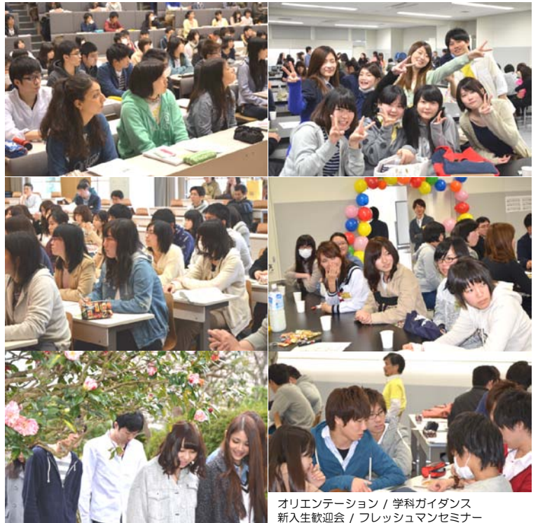
オリエンテーション / 学科ガイダンス 新入生歓迎会 / フレッシュマンセミナー