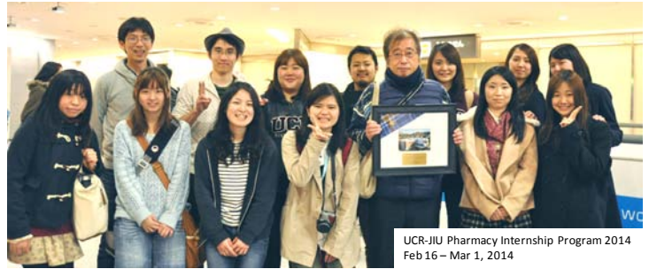
UCR-JIU Pharmacy Internship Program 2014 Feb 16 - Mar 1, 2014